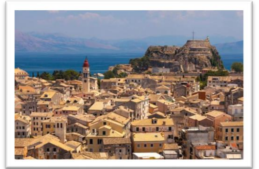
コルフ島旧市街（世界遺産）

ゆったりと過ごしたい方はコルフ島で1~2泊延泊されることをおすすめしています。世界遺産のコルフ旧市街・ヴェネツィア時代の要塞をのんびりと散策したり、ビーチで過ごしたり。島内には美術館や博物館も多く、「アジア美術館」では日本や中国、東アジアなどのコレクションを見ることができます。また、隣国アルバニアへの日帰りツアーも出ており、古代遺跡「プトリント」や森の中の秘境「ブルーアイ」へも気軽に行くことができます。