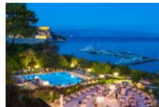
コルフホリデイパレス コルフパレス