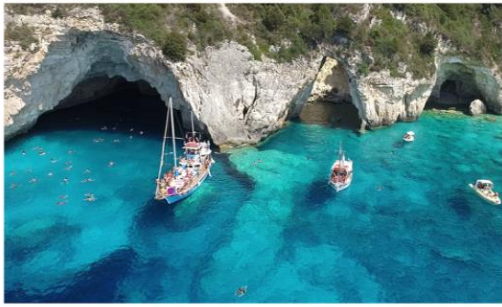
アンチパクシ島（洞窟クルーズ）

イオニア海の要塞の島「コルフ（ケルキラ）島」2泊+首都アテネ2泊を組み合わせた旅程です。コルフ島から、パクシ島 & アンチパクシ島への日帰りクルーズを組み込みました。クルーズは洞窟付近で停泊し、船から飛び込んでのスイミングも楽しめます。快晴の日には透き通るエメラルドグリーン色の青の洞窟を見ることができます。そのあとパクシ島のかわいらしい小さな漁村、ラッカ村を探索します。